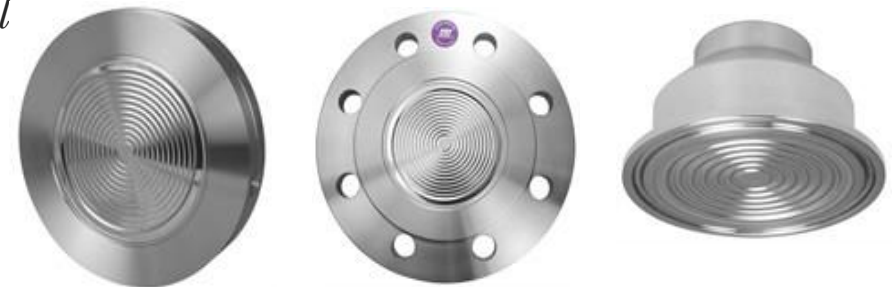
○ Chemical Diaphragm Seals